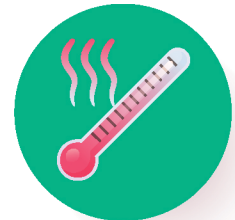
● ከፍተኛ ትኩሳት