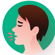
● ከባድ ሳል

የሕብረተሰብ ተሳትፎና ግንዛቤ ማስጨበጫ ንቅናቄ ማስተማሪያ ወ.መን ኢምፓውመንት-ኢክሽን ክፍያ ቅጽ ወረዳ ወይንም ጥበቃ ጽ/ቤት ጋር በመተባበር የተዘጋጀ