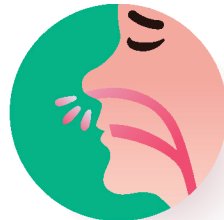
● የሕፃናት ፍሳሽ (ኮርይዛ)