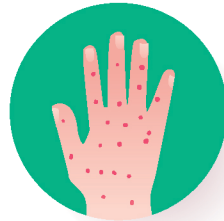
● ቀደይ ነጠብጣብ